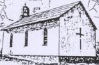
BUKOVA GORA - FIJALNA CRKVA SV. JOSIPA SAGRAĐENA 1974 GODINE