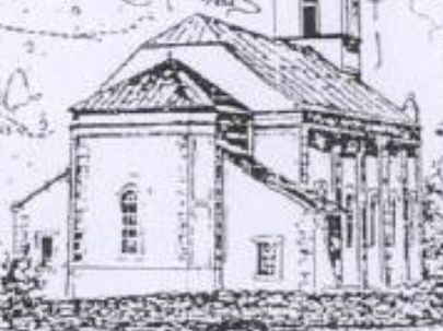
GRABOVICA - ŽUPNA CRKVA SV. ANTE PADOVANSKOG SAGRAĐENA 1917. GODINE